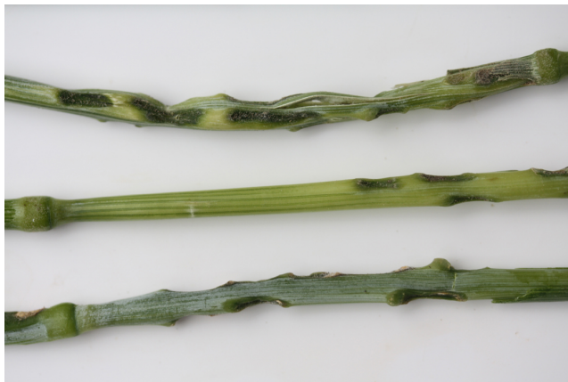
Billede 2. Angrebne strå med mange "sadler".