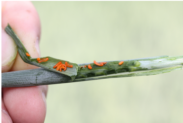
Billede 1. Mange sadelgalmyglarver.

Meldinger om evt. angreb modtages fortsat gerne.